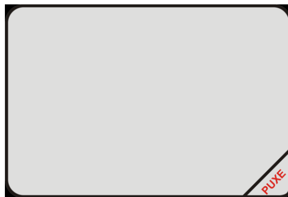
Figura 3 – Art.1º, VI - Indicação de “Puxe”.