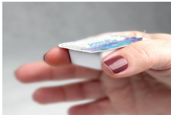
Figura 2 - Art. 1º, V - Acomodação da Embalagem.