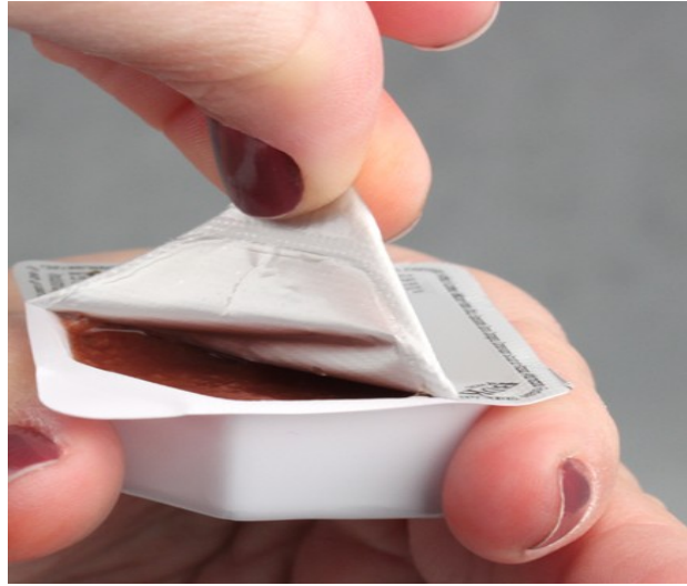
Figura 4 – Art.1º, VI, VII – Descolamento Integral da Tampa.