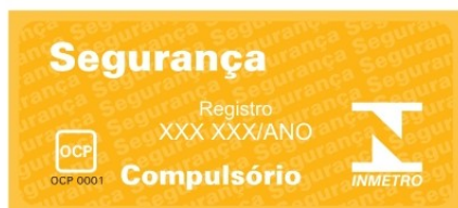
Figura A.1 – Formato e dimensões do Selo de Identificação da Conformidade.

A.2 Para os utensílios que possuam revestimentos deve ser utilizado o Selo de Identificação da Conformidade conforme a figura A.2, devendo ser apostado no rótulo na embalagem de forma impressa ou de adesivo, de forma clara, visível ao consumidor para sua decisão de compra.