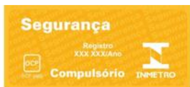
Figura 1 – Selo de Identificação da Conformidade

Pantone 1235 ■ 100% ■ 80% CMYK ■ C2 M34 Y94 K0 ■ C2 M27 Y90 K0