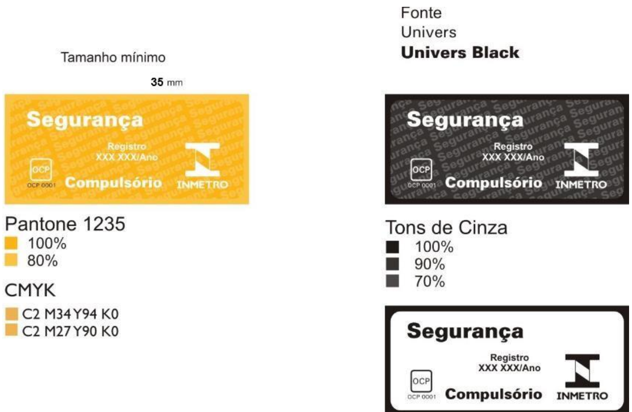
Figura 1: Selos de Identificação da Conformidade.

2.2 Os Selos de Identificação da Conformidade a serem aplicados às embalagens dos rolos, bobinas e carretéis são os apresentados na Figura 1 a seguir: